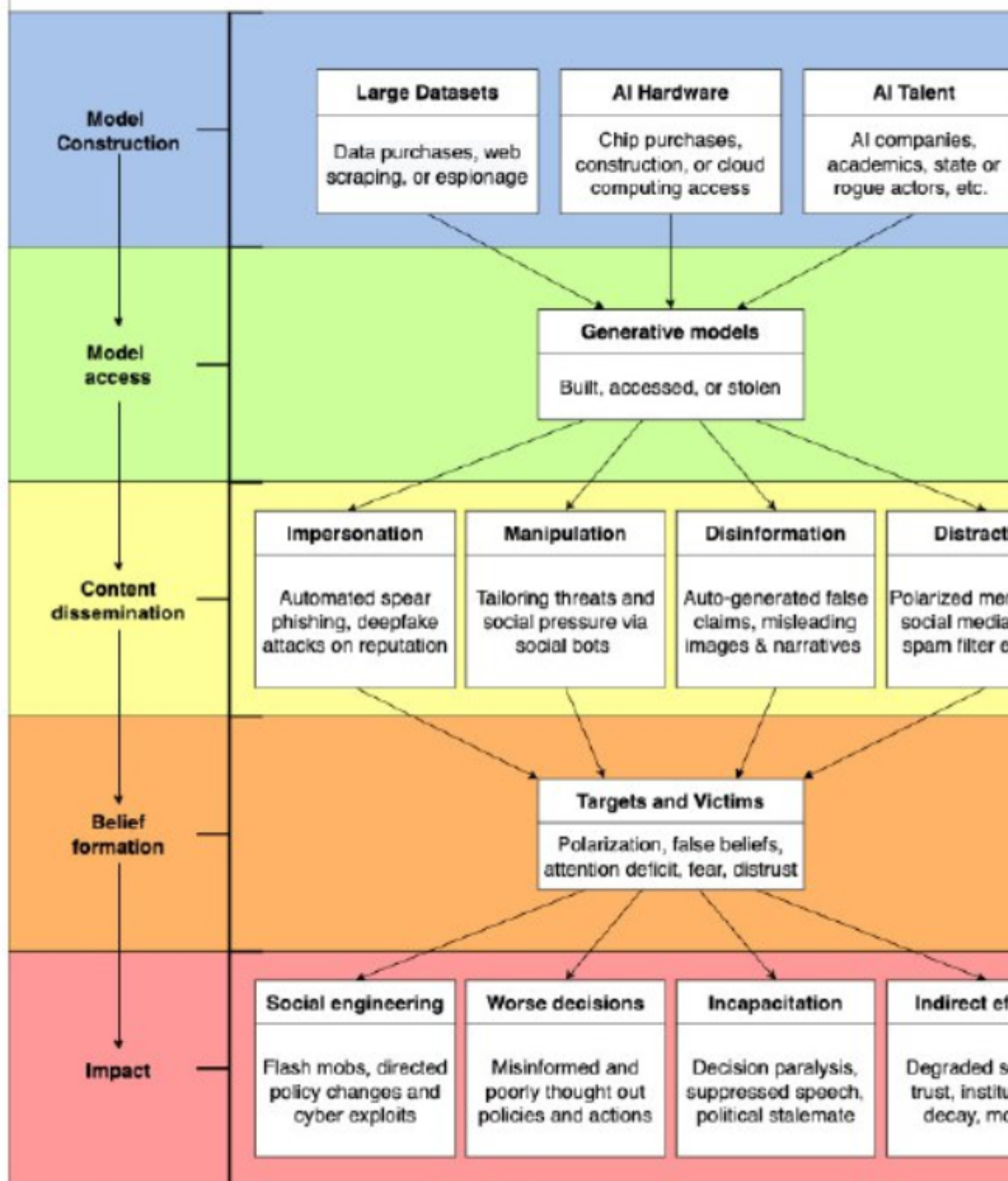
Figure 4: Stages of intervention of AI-enabled influence operations. To disrupt a propagation of language models for influence operations, mitigations can target four stages: (1) Model Construction, (2) Model Access, (3) Content Dissemination, and (4) Belief Formation. Intervening at these stages attempts to mitigate both the direct and indirect effects of influence operations.