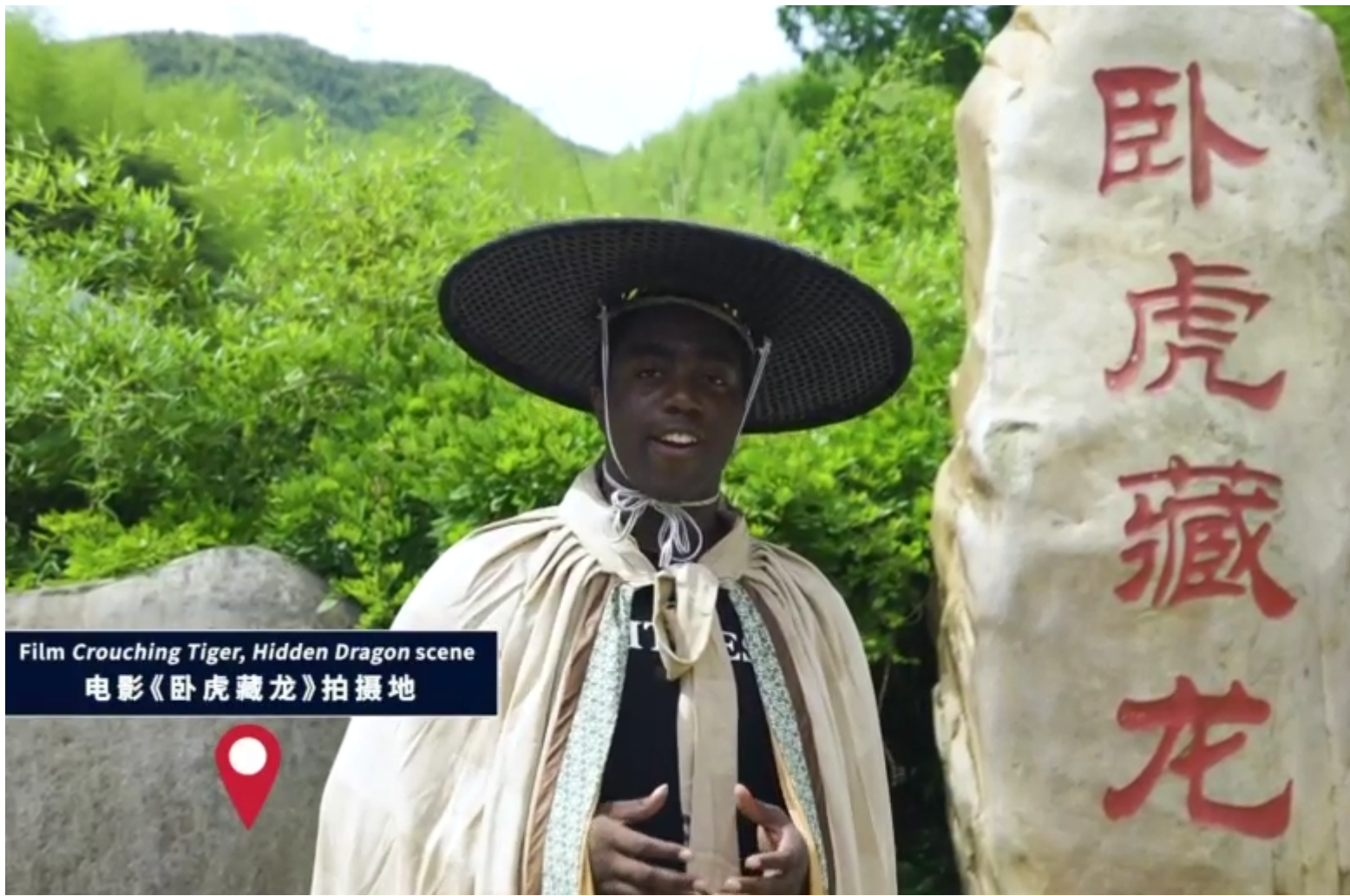
Film Crouching Tiger, Hidden Dragon scene 电影《卧虎藏龙》拍摄地